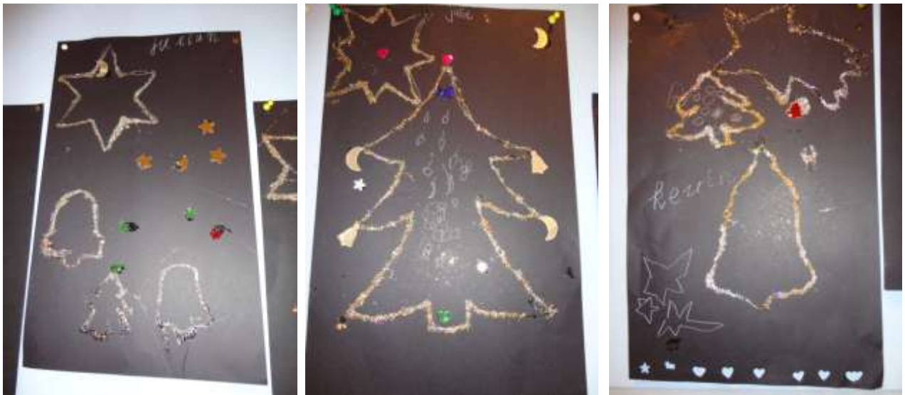
Glitter op zwart, gemaakt door kinderen uit groep 2-3.